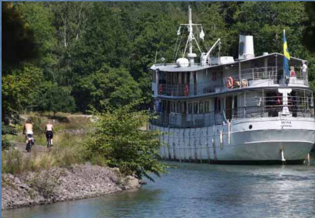
Göta Kanal går mellan Göteborg och Stockholm